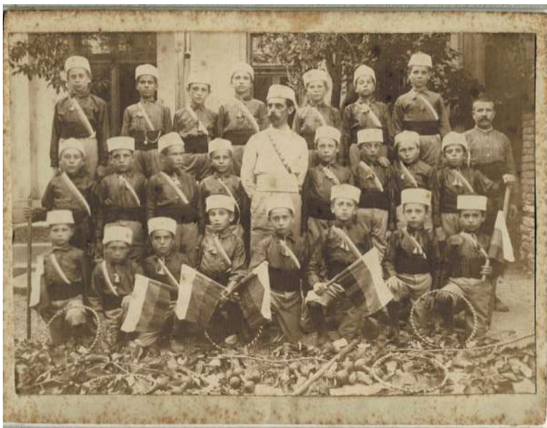
Участници в Областния юнашки събор, Стара Загора, 1929 г., Снимката е от фонда на РИМ–Стара Загора, 7С3 инв. № 3262/13.

ния и веселби. Гражданите се спасяват от летните жеги в близката околност – Беш бунар, Банкоолу, Айбунар, по бреговете на река Бедечка и парк Аязмото.