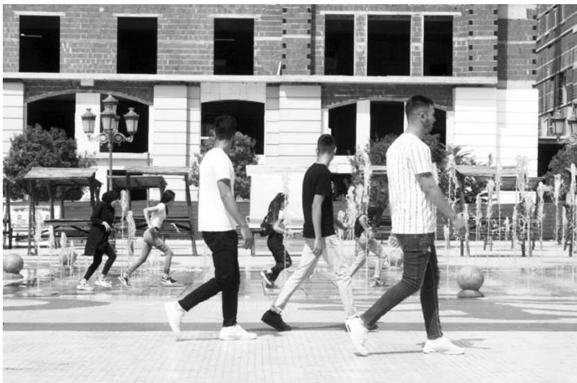
Изборни активности на фонтаната на плоштад „Македонија“, 05.09.2019 г.

неговата централната позиција. Со оглед на тоа што изборните активности се секундарни и укажуваат на квалитетот на просторот, на плоштадот се одвиваат и активности кои придонесуваат за благосостојба на посетителите: седење на клупа, комерцијално седење, сончање, забава, релаксација и други слични активности како дел од активностите за подобрување на животот на Скопјани и нивните гости.