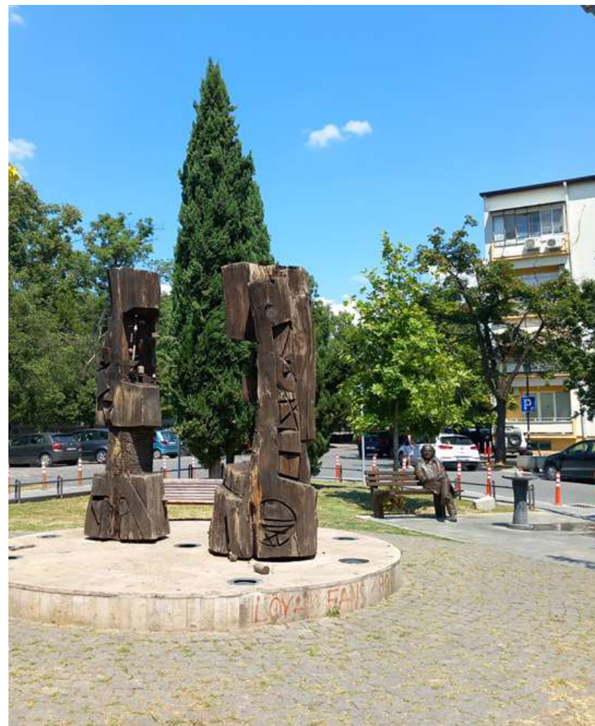
Паркот на Горан Стефановски, 10.08.2023 г.