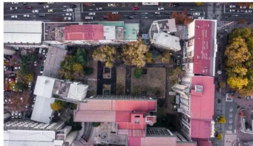
Фиг. 2. Паркот Форум прикажан од птичја перспектива.

Нашето истражувачко место, паркот „Форум“ се наоѓа во централното градско подрачје на град Скопје, во општина Центар. Типо-морфолошки, паркот „Форум“ преставува правоаголен парк дефиниран како внатрешен двор, тип атриум, ограничен со низа општествени, административни и станбени згради. Паркот е лесно достапен и високо фреквентен поради тоа што е добро поврзан со четири пасажи – пристапи, а дополнително се интензивира посетеноста поради тоа што на исток граничи со улица „Македонија“ и е во непосредна близина на плоштадот во Скопје. Локацијата е добро поврзана со јавниот транспорт бидејќи граничи со постојката „Рекорд“ каде застануваат скоро сите автобуски линии 5 .