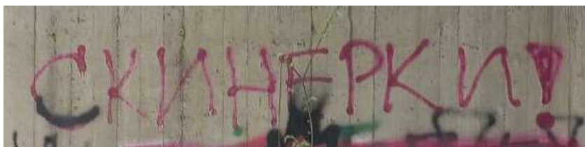
Фиг. 3. Скинерки! Натпис кој сведочи за припадноста на посетителите во паркот „Форум“.

Како јадро на таа младинска урбана култура која го посетуваше „Форумот“ беа лица припадници на разни супкултури, како што се: панкери, металци, скинери/скинхед(с)и, рапери, потоа припадници на навивачката група „Комити“, но и други „обични“ или „неформални“ групи на луѓе. Сите тие оставија свој белег врз овој јавен простор, така што со тек на времето може да се каже дека станаа и синоними. Кога ќе се спомнешевоевременно „Форумот“ веднаш во мислите доаѓаа овие разни супкултурни групи. Како доказ за нивниот дневен престој на овој јавен простор денес сведочат големиот број натписи/графити кои ги красат ѕидовите на станбените згради, пример: SKINHEADS, СКИНЕРКИ, SHARP 7 , Слобода за КОМИТИ, Комити 1987, PUNKS, SKINHEAD GIRLS и други.