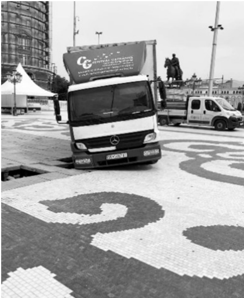
Камион на плоштад „Македонија“ бр. 3

За дефинирање на инклузивноста на плоштадот, набљудувани се следните аспекти: присуство на луѓе од различна возраст, пол, различни класи, различни култури, националности, раси и различни физички способности. Предмет на набљудување и анализа се и активностите и однесувањата на разновидните категории на луѓе, како и пристапноста и достапноста на просторот во однос на поблиското опкружување.