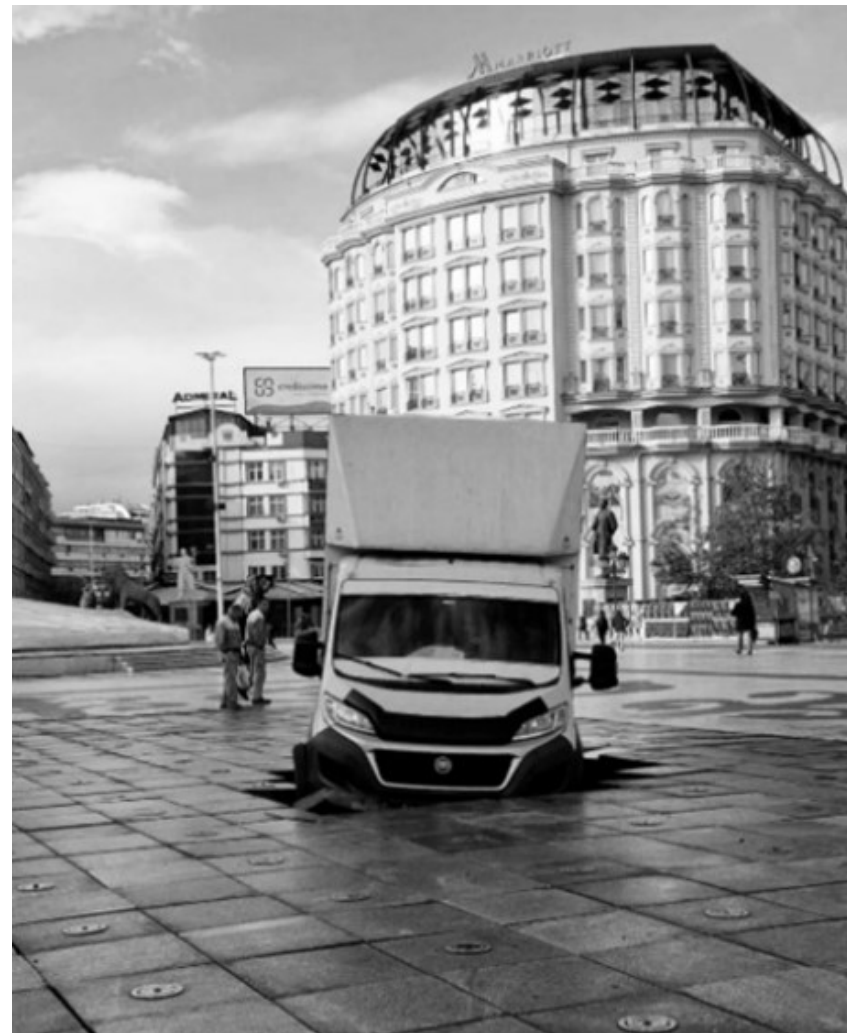
Камион на плоштад „Македонија“ бр. 2, преземено од: https://telma.com.mk/2022/11/23/kamion-povtorno-propadna-na-ploshtadot-makedonija/ (пристапено на 13.07.2023 г.).