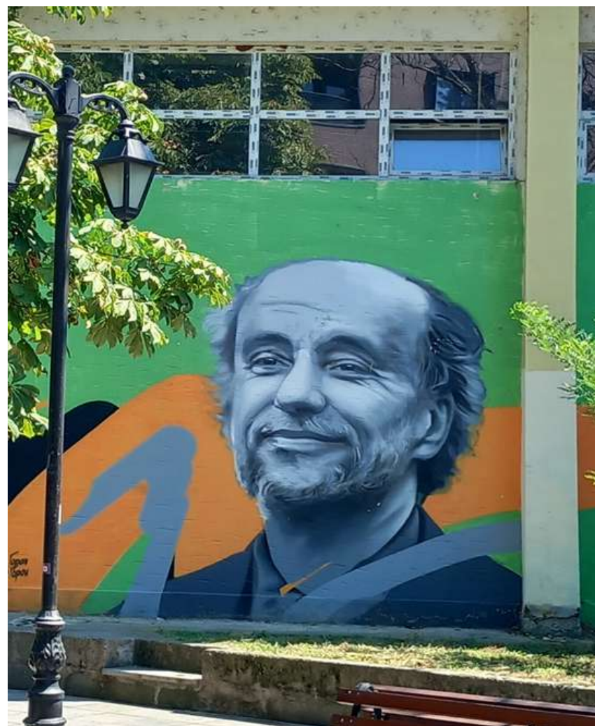
Муралот на Горан Стефановски, 10.08.2023 г.