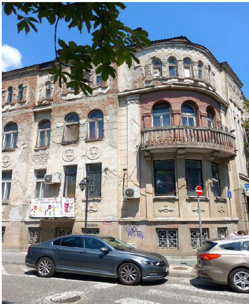
Дел од зачуваната градска архитектура на Дебар маало од триесеттите години на минатиот век, 10.08.2023 г.