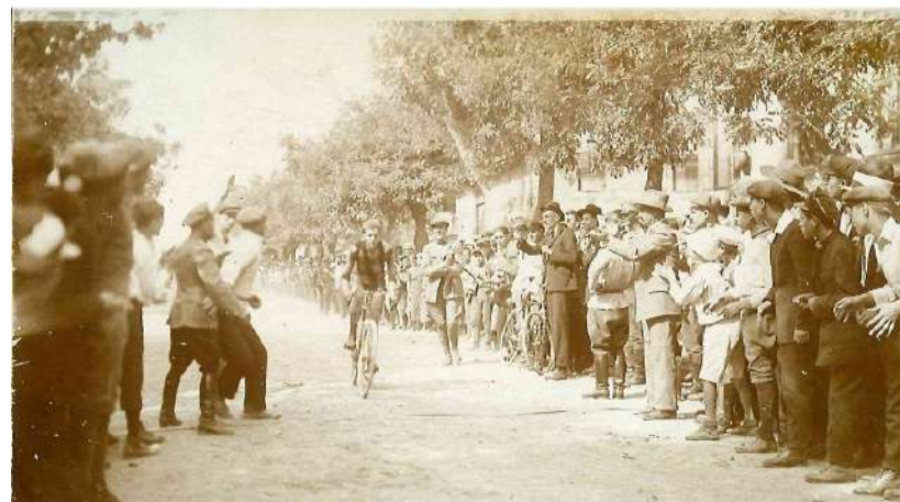
Състезание по колоездене, Стара Загора, 1915 г. Снимката е от фонда на РИМ–Стара Загора, 7 Сз 3384.

след мачовете, което допълнително настройва консервативното местно общество срещу ритнитопковците .