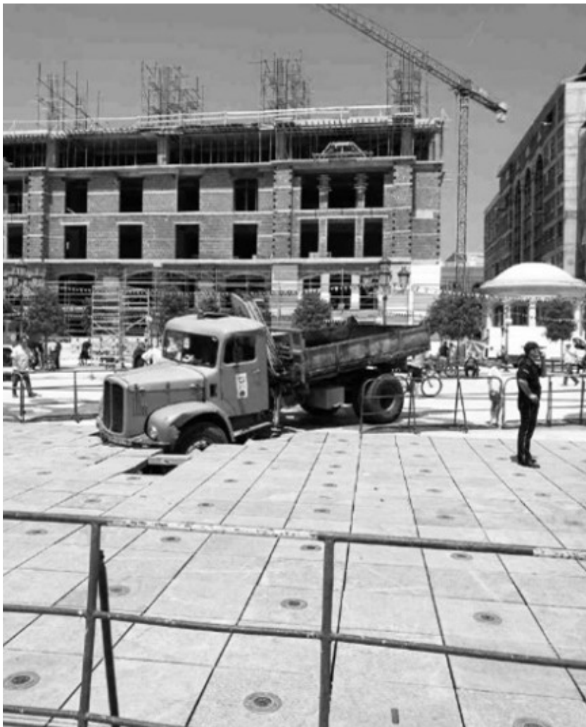
Камион на плоштад „Македонија“ бр. 1