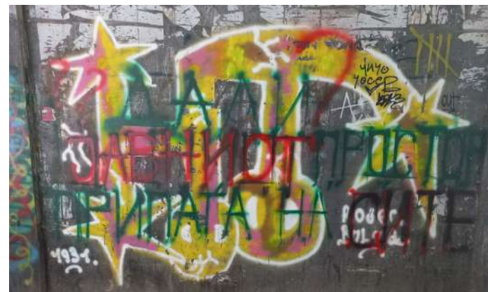
Фиг. 5. „Дали јавниот простор припаѓа на сите?“

Но, тука веќе се назира една друга појава, односно се отвара едно прашање кое дава простор за полемизирање. Прашањето е: Дали јавниот простор припаѓа на сите? Случајно или не, ова прашање некој го поставил на сидот на еден од пасажите кои водат до „Форумот“.