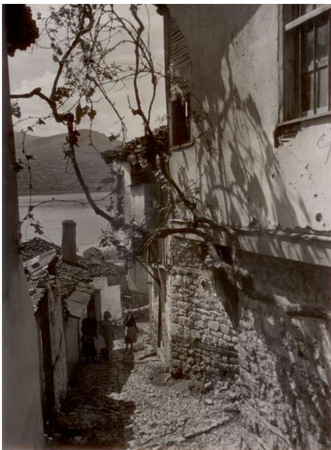
Стара улица в Охрид, фотография на Божидар Карастоянов. [1941г.] НБКМ - БИА, СП 4212.

Образите/лицата на Охрид, създадени от фотографите, са много и различни, но безспорно интригуващи. Ясно подчертан е християнският облик на града и историческото му минало – например чрез заснемане на крепостта. Същевременно е документирано Охридското езеро, превърнало се в притегателен център за туристи и в ускоряващ фактор за развитието на туризма – една от важните предпоставки за стабилизирането на икономиката на града в навечерието на Втората световна война.