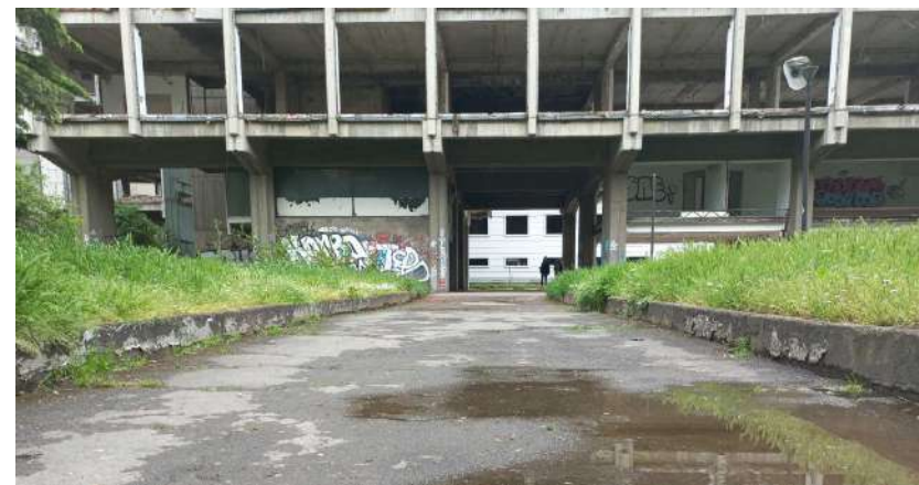
Фиг. 1. Јавниот простор „Форум“.

Токму ваквите две различни спротоставени доживувања на „Форумот“ беа поттик да се втурнеме кон едно сериозно научно истражување во кое ќе ги вкрстиме пред сè нашите појдовни перцепции за овој јавен простор, но секако ќе се обидеме да дадеме одговор на повеќе чинители поврзани со ова место.