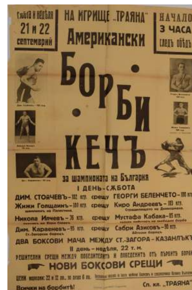
Афиш за организираниите от СК „Траяна“ борби, Стара Загора, септември 1935 г.