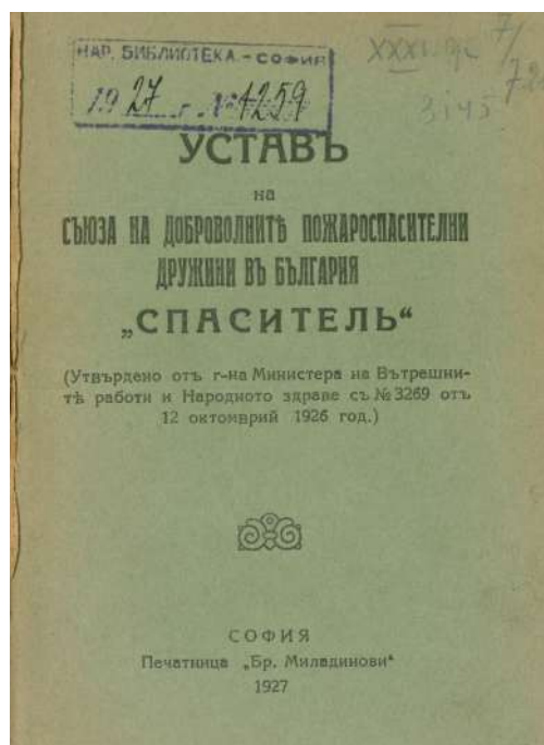
Устав на Съюза на доброволните пожароспасителни дружини в България „Спасител“. София. 1927 г.

на пътища, събирането на средства за бойните действия и т.н. След 1878 г. част от тях изграждат мрежата на Българския червен кръст и други доброволчески организации (Георгиева 2018: 25–27; Стоименова 2008: 58). В контекста на природните бедствия и катастрофи доброволците имат съществена роля за преодоляване на последиците – инфраструктурни и дори емоционални. Те се притичат на помощ на структурите на Министерството на вътрешните работи и армията при спасителни дейности и потушаване на стихията. Този вид доброволчество официално възниква у нас през 1896 г. Тогава в Русе е основано първото доброволно пожароспасително дружество „Развитие“, което не просъществува дълго поради липсата на средства и дейност. Десет години по-късно (1906 г.) дружеството е преучредено и преименувано на „Спасител“. Второто е основано същата година в Шумен (Симеонов 2001: 23).