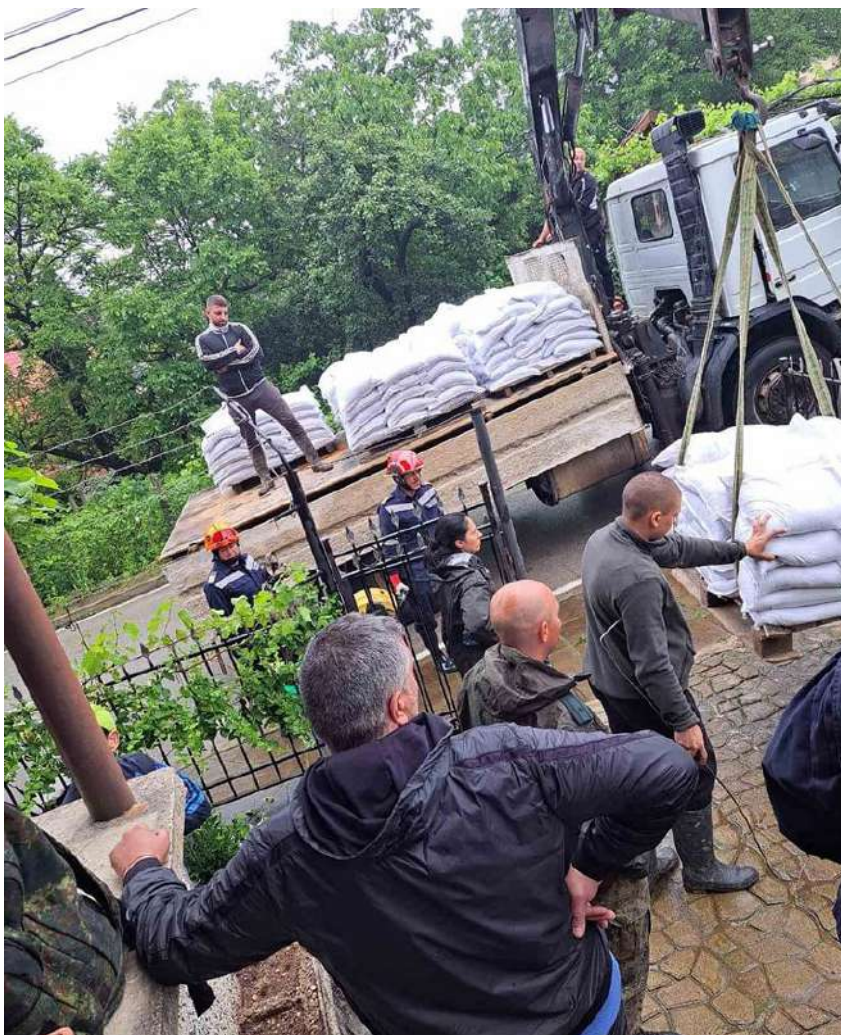
Един от петте камиона, които платформата „Гората.бг“ дарява на община Берковица след наводнението на 12.06.2023 г.