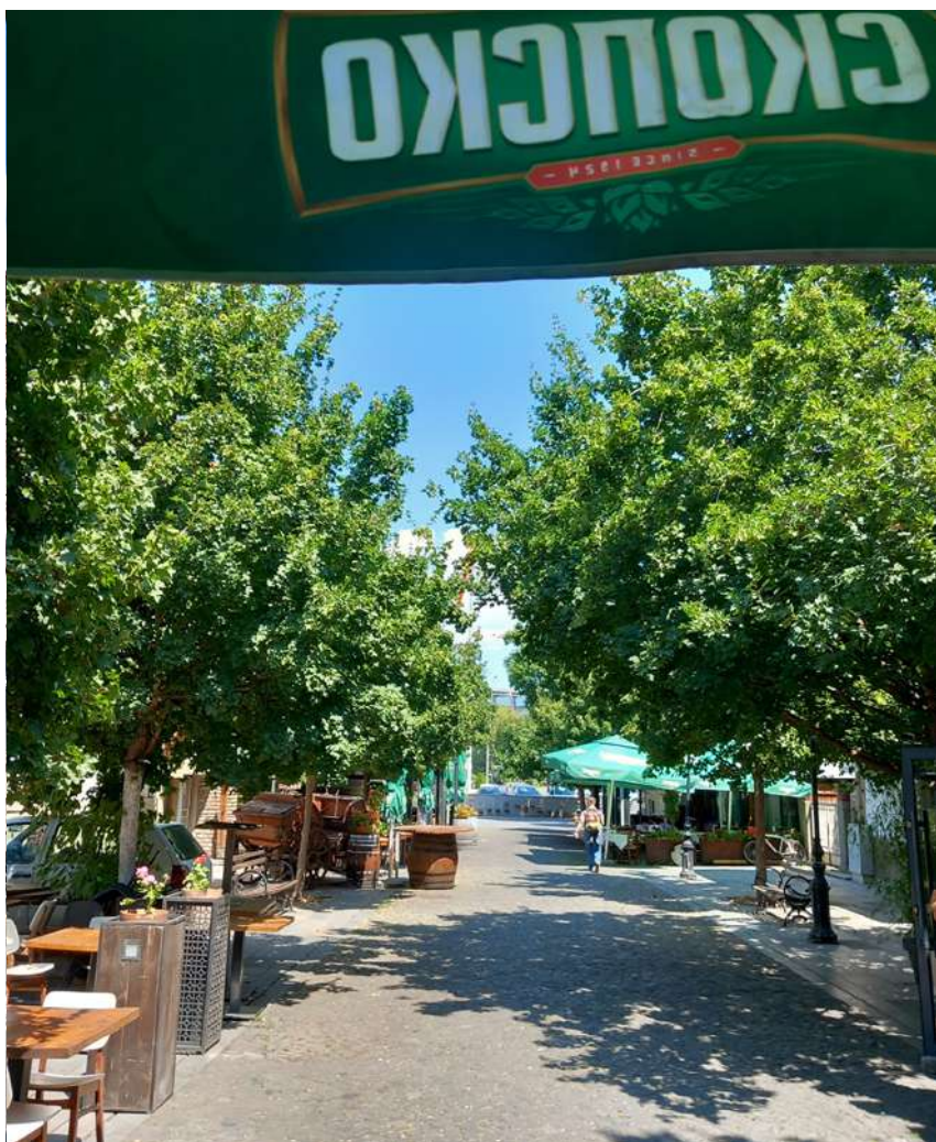
Боемска улица, 10.08.2023 г.