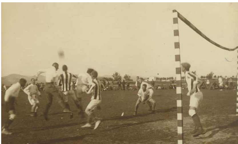
Футболна среща на игрището на Герджиковия алан, Стара Загора, 30-те години на XX в., Снимка от фонда на РИМ–Стара Загора, 7Сз, инв. № 3076.