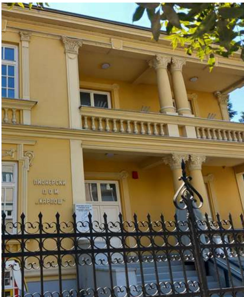
Зградата на Пионерски дом Карпош, 10.08.2023 г.